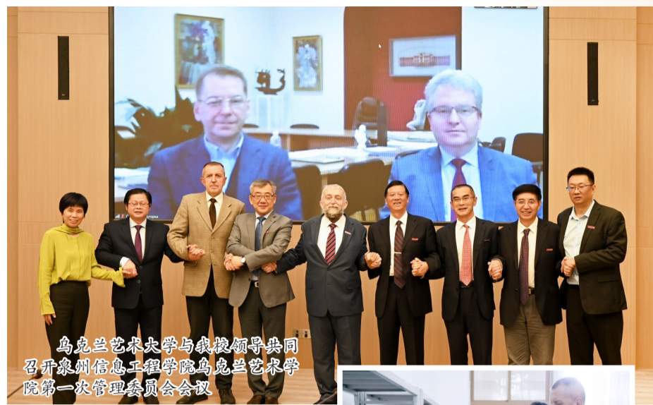
乌克兰艺术大学与我校领导共同召开泉州信息工程学院乌克兰艺术学院第一次管理委员会会议

本次访问加深了中乌两校间的友谊,提升了相互之间的工作默契,为接下来的工作奠定了良好的基础。通过交流,两校在育人模式和人才培养上统一思路,明确目标,双方希望在共同努力下用最优的教育模式