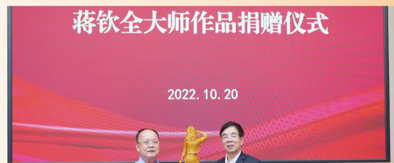
蒋钦全大师作品捐赠仪式