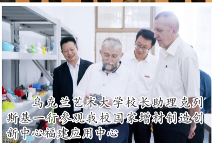
乌克兰艺术大学校长助理克利斯一行参观我校智能制造创新中心福建应用中心

培养具有宽广国际视野、较高艺术修养、适应全球化经济发展形势的高水平艺术设计人才。后续双方计划以乌克兰艺术学院为平台继续推动中乌文化艺术领域的深入交流与合作。