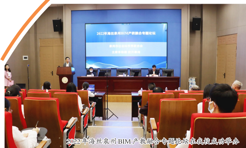
2022年海丝泉州BIM产教融合专题论坛在我校成功举办

本报讯 11月27日上午,由泉州市社会科学界联合会、泉州市住房和城乡建设局、泉州市教育局、共青团泉州市委员会主办的2022年海丝泉州BIM产教融合专题论坛,以线上线下相结合的方式在我校顺利举办。